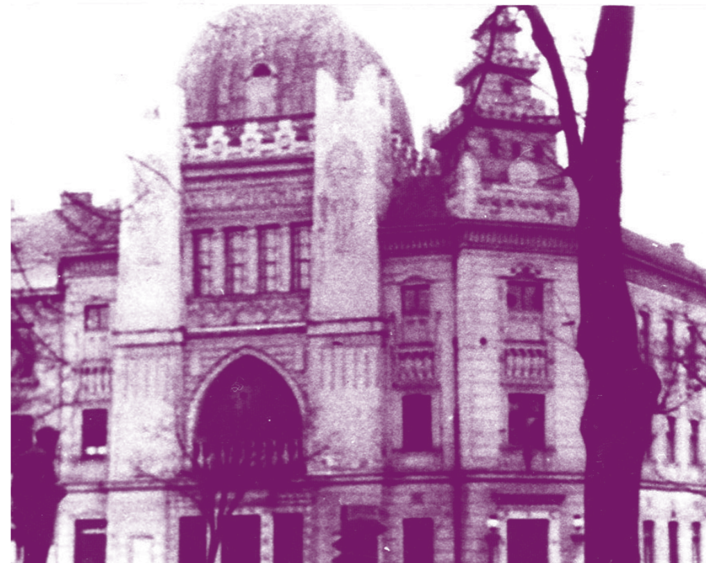
Synagoga v Hradci Králové