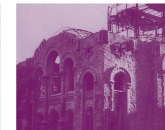
Trosky zničené synagogy v Olomouci