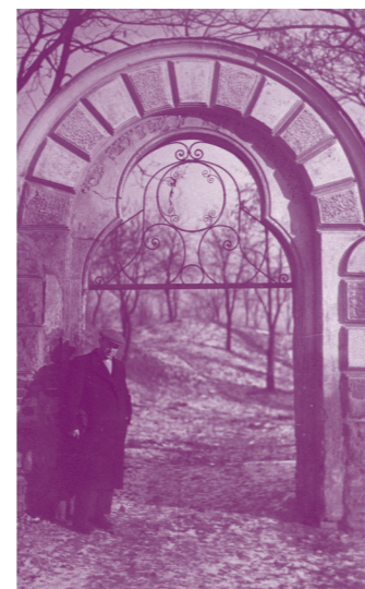
Zničená vrata na židovském hřbitově v Uherském Brodě