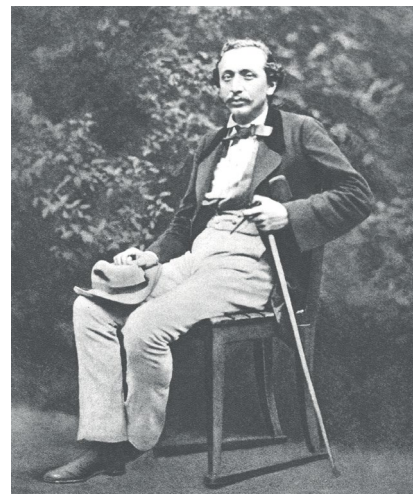
159 – Jan Neruda

4. Vláda jest povinna zabrániti přístupu a usídlení z ciziny příchozím židům. Každá obec měžž právo zabrániti usazení se