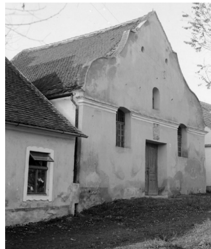
229 – Synagoga v Polici, 1942

„V malé obci severních Čech bylo již několik dnů nemalé rozčilení. Očekávali mladého rabína, a jednoho dne jel starosta obce s několika nejváženějšími a nejstaršími muži pět mil daleko do města, aby tam toužebně očekávaného rabína co nejslavnostněji přivítali a doprovodili do nového sídla jeho působnosti. Když tam dorazili, nenalezli však ani stopy mladého rabína a veškeré dotazování a hledání jejich ukázalo